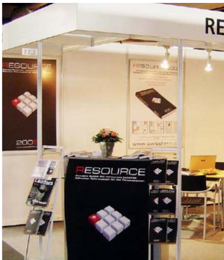
RESOURCE 2012 sur le stand H.02